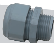
Pg rechte koppeling, uitwendige draad, plastic (PA6)