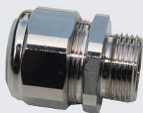
Pg rechte koppeling, uitwendige draad, messing vernikkeld