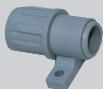
Raccord droit, avec support à patte de fixation, tournant, en plastique (PP)